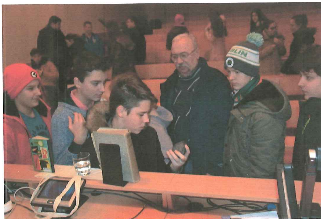
Hubble vászna – Edwin Powell Hubble és a Hubble űrtávcső – Rozman Béla