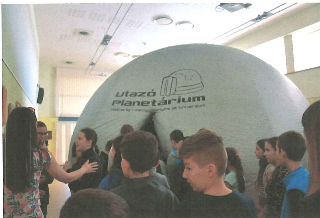
Utazó Planetárium – A csillagos ég titkai

4400 NYÍREGYHÁZA, SZABADSÁG TÉR 2. TELEFON: +36 42 598 888; FAX: +36 42 404 107 E-MAIL: TITKARSAG@MZSK.HU