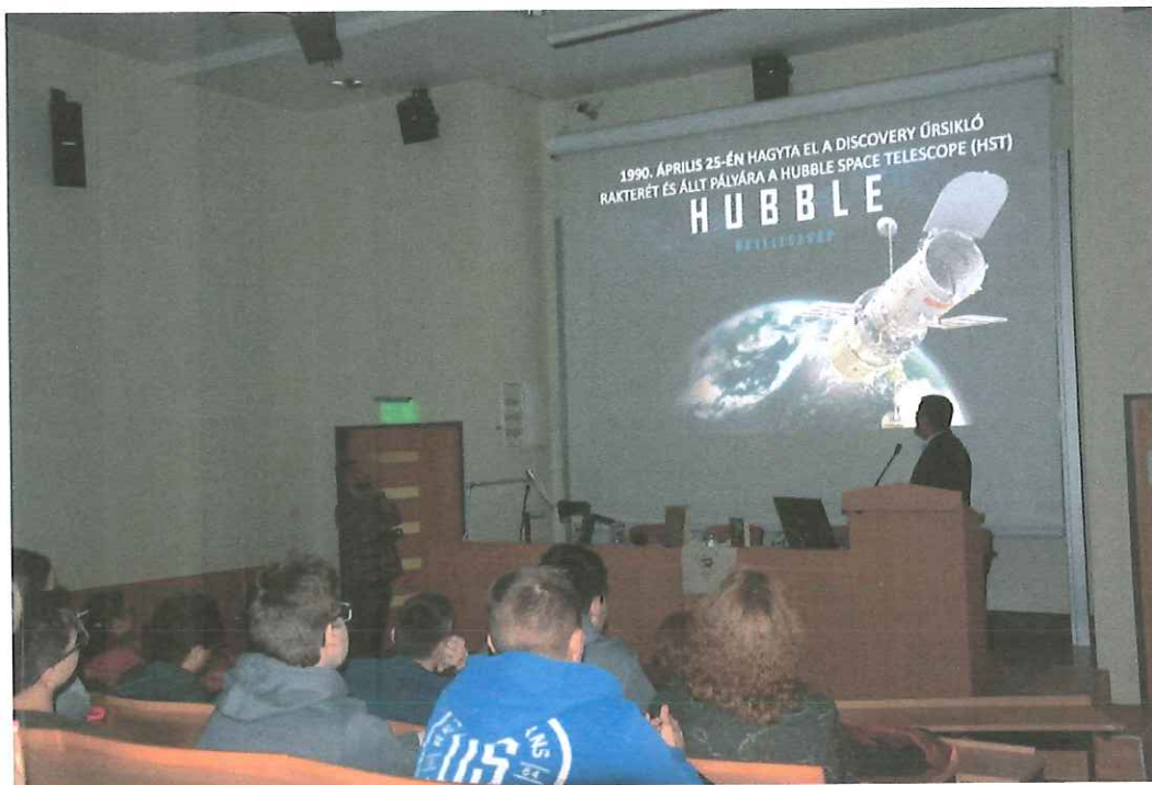
Hubble vászna – Edwin Powell Hubble és a Hubble űrtávcső – Rozman Béla