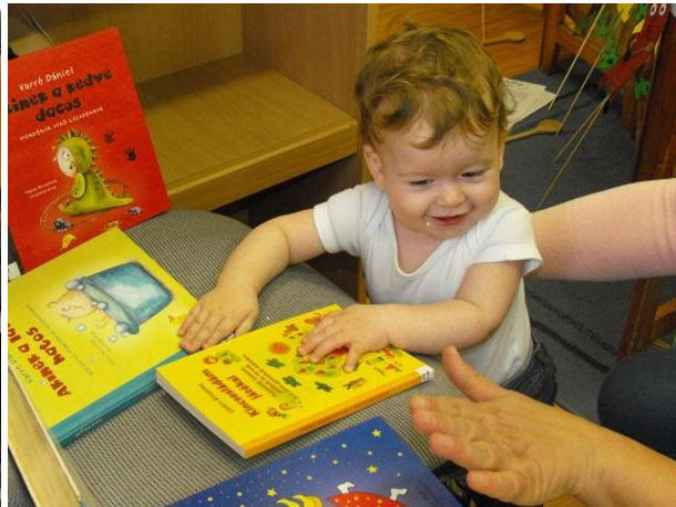
2017.10.04. Nyári olvasópályázat díjkiosztó 68 fő 2017.10.06. Baba-Mama olvasó 16 fő