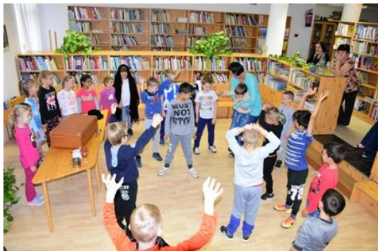
2017.10.05. A mesék bűvöletében 24 fő