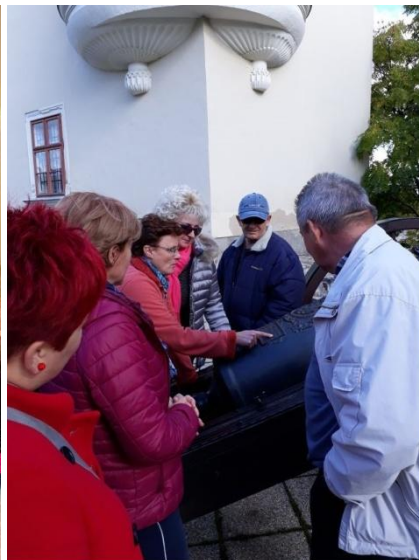
2017.10.07. Bakancsot fel! 26 fő