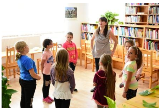
2017.10.02. Kincskereső meseterápia bemutató 7+10 fő