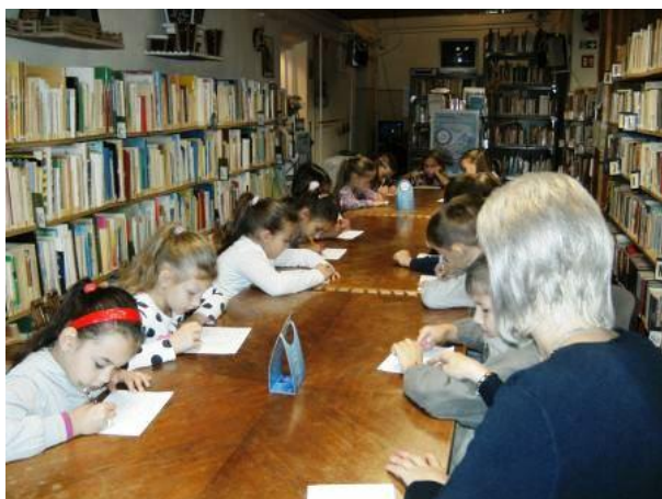
2017.10.03. Cseptől a tengerig 43 fő