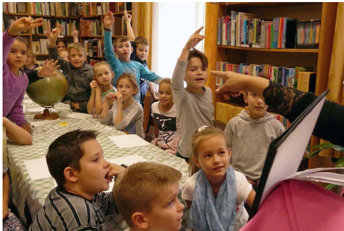
2017.10.05. Életünk a víz 27 fő