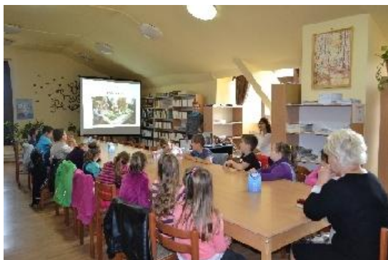
2017.10.05 Népi hagyományok, múltunk forrásai 47 fő