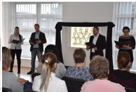
2017.10.06. Emlékezzünk régiokról 28 fő