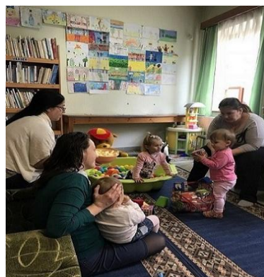
2017.10.05 Az első kötődés fontossága 12 fő