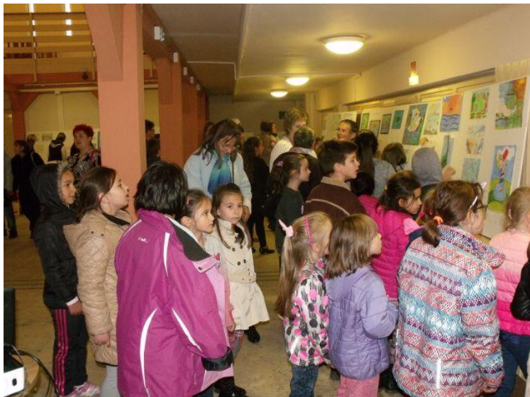
2017.10.05. A víz arca 109 fő