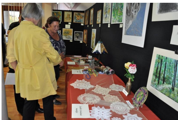
2017.10.02. Kreatív Olvasók VI. 60 fő