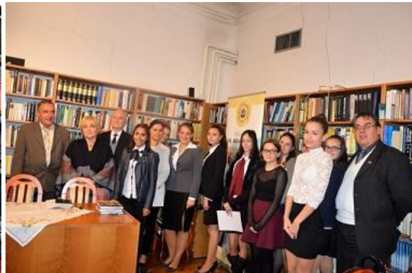
2017.10.04. Polgárosodás és megújulás Kisvárdán a kiegyezés után 75 fő 2017.10.05. Csak tiszta forrásból 25 fő