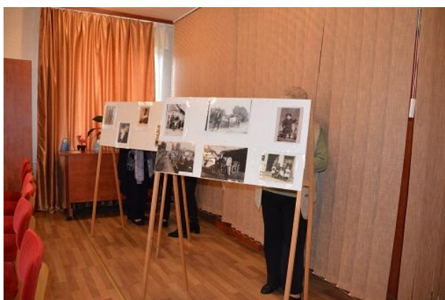
2017.10.06. Múltunk forrásai 36 fő