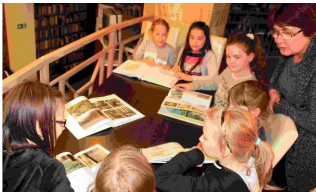
2017.10.06. Kalandozások a mondák világában 25 fő