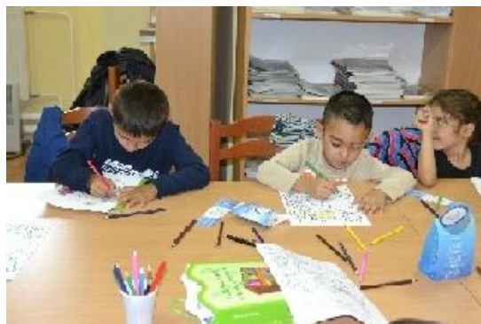
2017.10.04. Víz: az élet forrása 22 fő