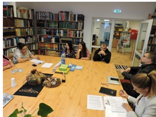
2017.10.03. Boldogság forrásai, beszélgetések szakemberek 12 fő 2017.10.03. Keresd a máriapócsi könyvtárban 21 fő