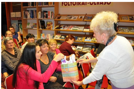
2017.10.05. Boldogságra születünk 46 fő