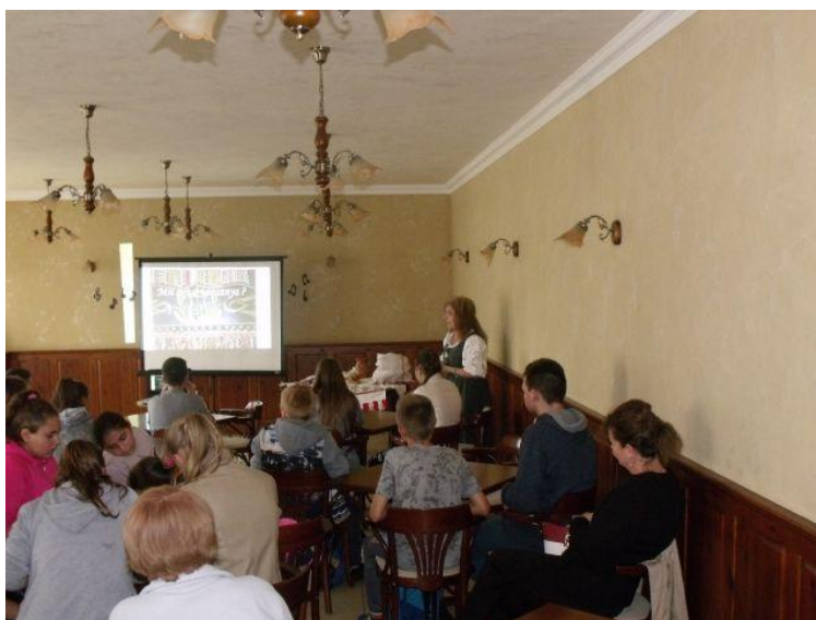
2017.10.06. Mit rejt a tarisznánk? 38 fő