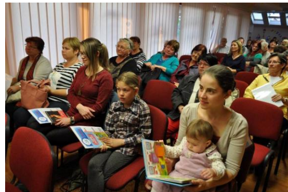
2017.10.02. Olvasni jó 44 fő