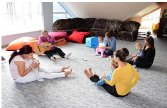
2017.10.03. Hangok bűvöletében 9 fő