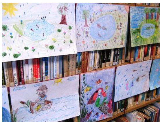
2017.10.06. Mesék vizei