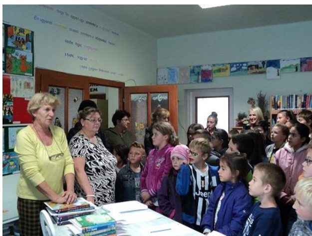
2017.10.03. Múltunk forrásai, a népmesék 278 fő