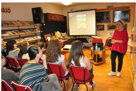
2017.10.09. Az út, ahol a csodák tényleg megtörténnek 50 fő