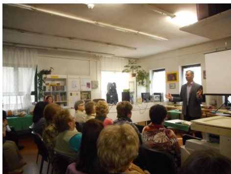
2017.10.04. Boldogság forrásai, beszélgetések szakemberekkel 41 fő