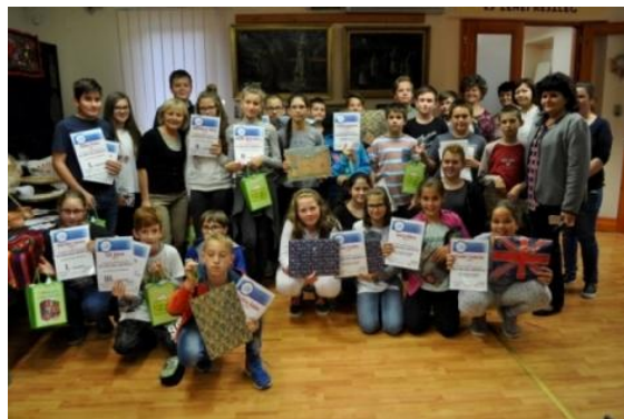
2017.10.03. Ne csak lógj a neten! XI. 37 fő