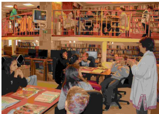
2017.10.04. Ki tud többet a rakamazi Nagy-Morotváról? 17 fő