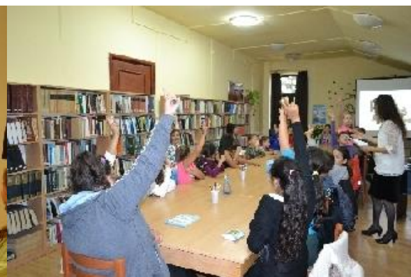
2017.10.03. Információforrások, tudásforrások 22 fő