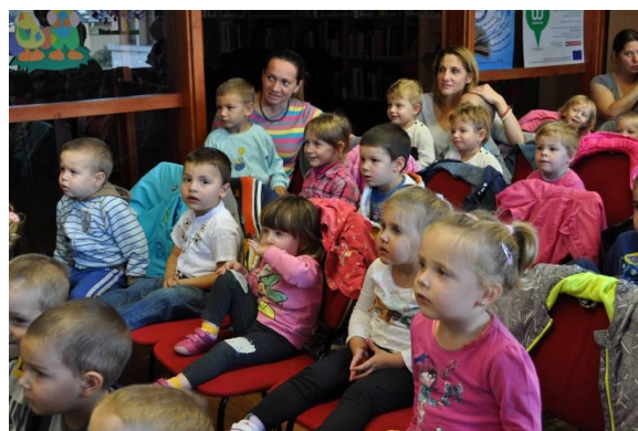
2017.10.04. Baba-Mama klub 74 fő