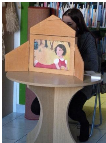
2017.10.02-05. Papírszínház 110 fő