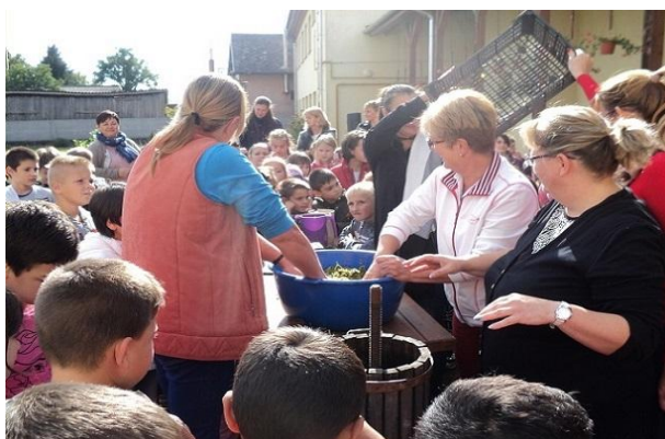
2017.10.04. Szüretelnek, énekelnek, láttál-e már ennél szebbet? 274 fő