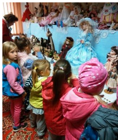
2017.10.03. Baba kiállítás 102 fő