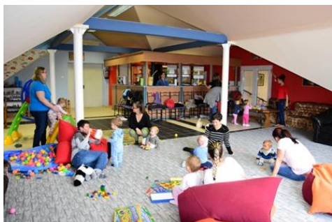
2017.10.05. Drága kincs a gyermek 22 fő