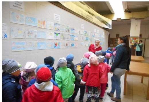
2017.10.05. Víz: az élet forrása 77 fő