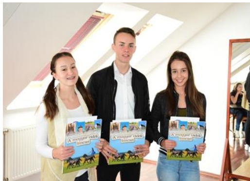
2017.10.04. Irodalmi vetélkedő 44 + 46 fő