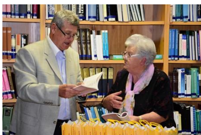
2017.10.03. Könyvbemutató 20 fő