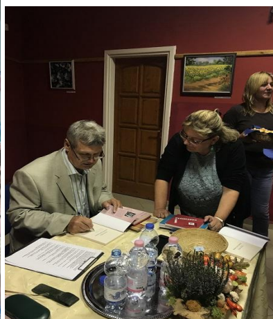
2017.10.02. Hangyautakon 20 fő