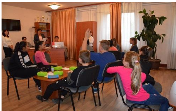
2017.10.05. Irodalmi barangolás 28 fő