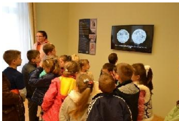
2017.10.02. Médiavisszhang, sajtózás 50 fő