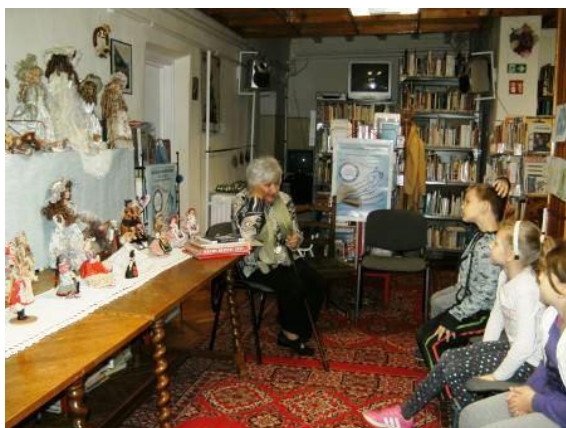
2017.10.05. Barangolás a népmesék a világába 79 fő