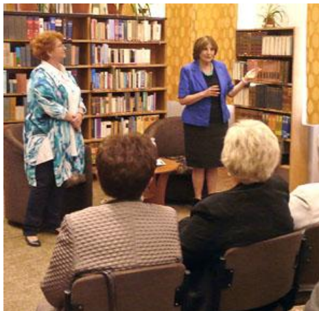
2017.10.07. Korhatártalanul 38 fő