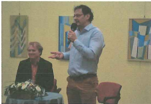
2019. 02. 07. Költők egymás közt (Lackfi János)