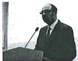
Mórícz a középpontban Mórícz Zsigmond és Kőrös Gyula szépprózai és lírai összehason- lítású műveit megújított és kiadta a Mórícz Zsigmond Szövetség 140. évfordulója alkalmából rendezett konferencián pénteken.

Mórícz a középpontban. In: Kelet-Magyarország, 2019.09.23., p. 12.