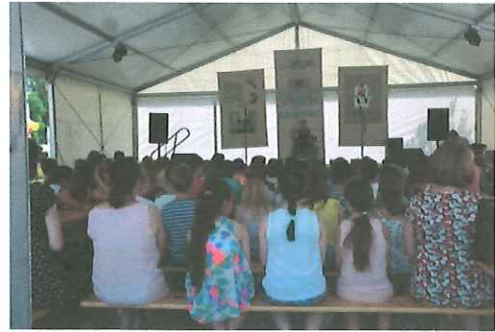
2019. 06. 13. Ünnepi Könyvhét