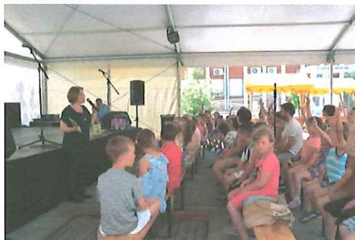
2019. 06. 13. Ünnepi Könyvhét