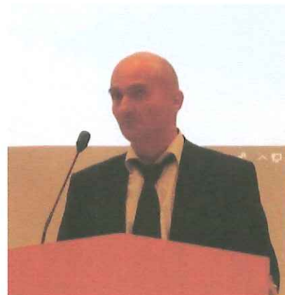
2019. 09. 20. Móricz Konferencia