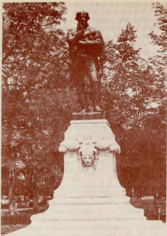
Kallós Ede: Bessenyei (1899)