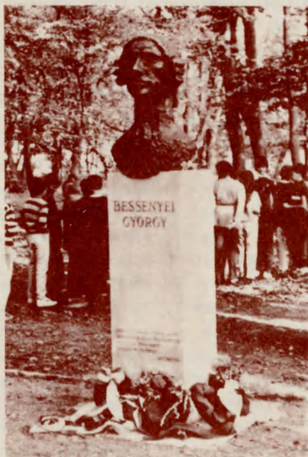
Somogyi József szobra Sárospatakon (1988)