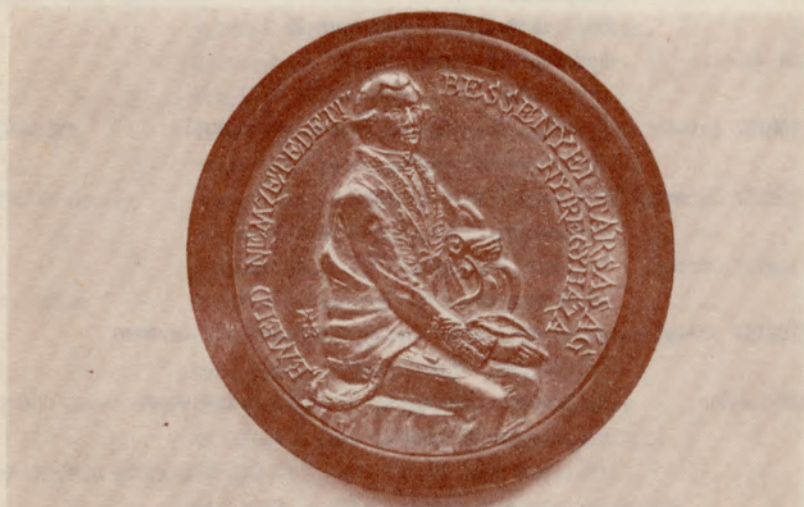
Nagy Lajos: Bessenyei Társaság Emlékérem